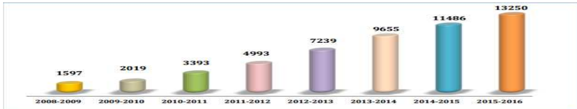
Şekil 4: Öğrenci Sayısındaki Yıllara Göre Değişimi

Söz konusu sayılar içerisinde 2014 yılında 9 öğrenci (4'ü hukuk fakültesi öğrencisi), 2015 yılında 1 öğrenci, 2016 yılında 1 öğrenci Erasmus değişim programı ile öğrenci öğrenim hareketliliğine katılmıştır. Görüldüğü üzere hukuk fakültesi içerisinde yalnızca 4 öğrenci değişim programına katılmıştır. Yalova