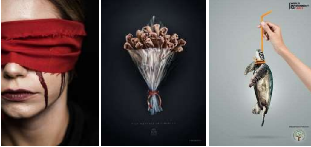
Görsel 18, 19, 20

Görsel 18 ve Görsel 19 kadına şiddetin yansıtıldığı diğer afişlerdir. Bu kez afişte bir kadın fotoğrafı kullanılmış fakat gözü kapatılmıştır. “ Kan ağlamak ” deyiminin görselleştirildiği bir afiş olmuştur. Görsel 19’da da kadınlara sunulması gereken buket çiçekler yerine aynı buket içerisine yumruk haline getirilen eller yerleştirilmiş ve bu şekilde şiddet temsil edilmiştir.