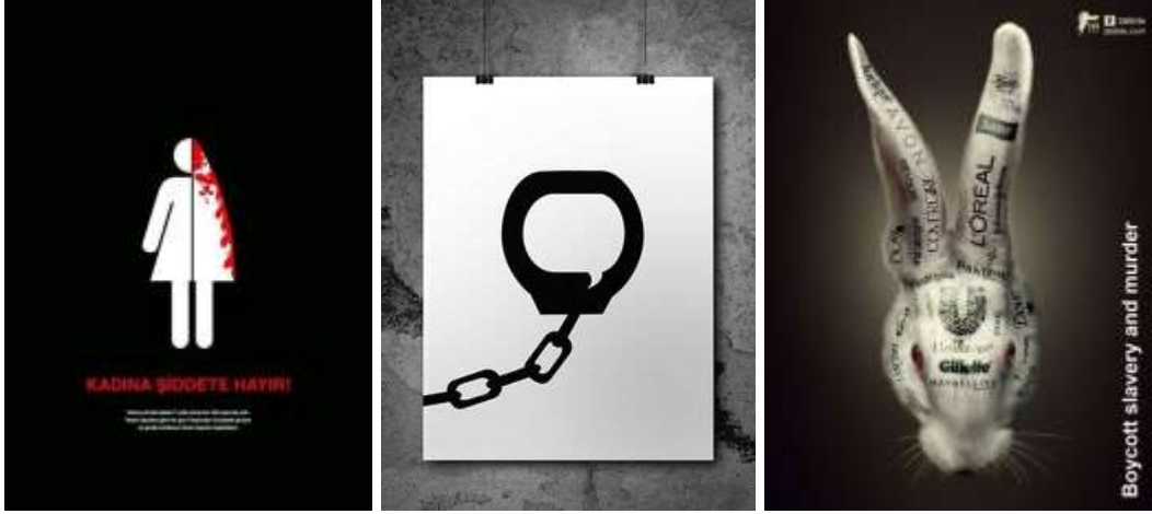
Görsel 23, 24, 25

Görsel 23'de kadına karşı şiddet bir kadın ikonunun yarısı ile bir bıçak silüetinin birleşmesinden oluşan figürle kurgulanmıştır. Bıçaktaki kan izleri şiddet unsurunu pekiştirirken görsel bütünlüğün sağlanması afişe ironik bir ifade katmıştır. Görsel 24 ise konuşma/ifade özgürlüğünün kısıtlanmasını yansıtmaktadır. Bu da bireyin haklarına karşı uygulanan bir şiddet biçimidir ve tutsaklığı temsil eden kelepçe görseli ile yansıtılmıştır. Son olarak Görsel 25 ise hayvanlar üzerinde deney yaparak üretilen kozmetiklerin, hayvanların yaşamı üzerindeki olumsuz etkisini ve onların neslinin devamlılığına mani olan olumsuz durumları ifade etmektedir. Bunun bir katliam olduğunu vurgulanmıştır. Yaşama hakkının ve özgürlüğün gaspı da şiddetin bir türüdür.