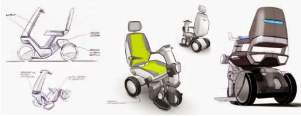
Görsel 4

Endüstri ürünleri tasarımı başlığı altında, günlük hayat objelerinden olan ve bireylerin direk kullanımına yönelik olarak düşünülmüş, faydalı nesnelerin tümü yer almaktadır. Teknolojiyle birleşsin ya da birleşmesin tüm bu tasarım ürünleri -elektrikli bisikletler, araçlar, küçük ev aletleri, koltuklar, sandalyeler, çalışma masaları, dekoratif ürünler vs.- ergonomik ve işlevsel olmaları bakımından, tasarım ürünleri kategorisinde yer almaktadır.